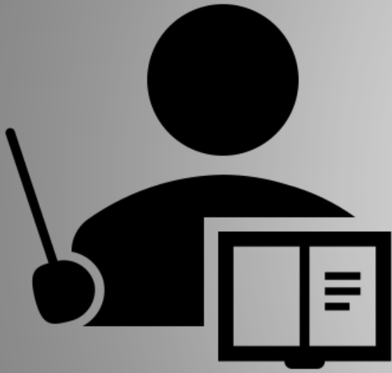
專任人員 (含專案人員)